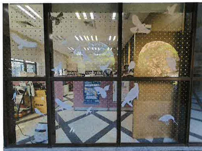
臺灣大學思亮館之鳥類友善窗戶布置。

過去曾提倡使用猛禽圖案的貼紙來防止窗殺，已被證明無法嚇鳥不靠近玻璃，許多張貼稀疏猛禽貼紙的建物仍持續地有野鳥撞窗事件發生。若要使用猛禽貼紙，也要符合「5x10公分原則」來張貼才會有效，可以配合其他的素材，例如圓形標籤貼紙、直條貼紙等來合併布置改善。過去建築物常使用的鐵花窗、壓花玻璃、馬賽克玻璃等其實都是很好的鳥類友善建材，可惜近年來已經不流行了。若您家中、學校、工作場所曾有野鳥撞窗，可以嘗試用「5x10公分原則」來布置玻璃，也歡迎大家遇到野鳥窗殺事件能通報臉書社團「野鳥撞玻璃回報」或「台灣路死動物觀察網」，若是想要了解更多窗殺資訊或下載摺頁與教育宣導資訊，歡迎上「野鳥窗殺博物館」網站逛逛。